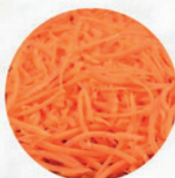
HILO O PAJA